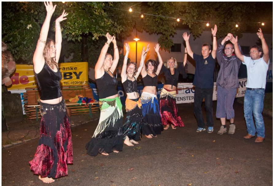
Bild 12 und 13: Einige Musikanten und Besucher des Musikfestes versuchten sich im Bauchtanz.

Am Sonntag spielte das Wetter dann wieder mit und es konnte ohne weiteres die Feldmesse gehalten und anschließend der Frühschoppen vom Musikverein Radlbrunn gespielt werden. Heuer wurden wieder langjährige Vereinsmitglieder durch den NÖ Blasmusikverband geehrt.