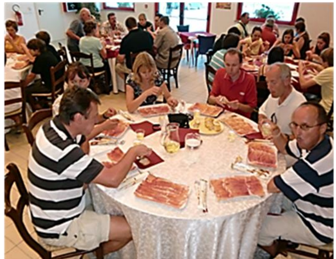
Bild 18: Der Musikverein beim Verkosten des berühmten San-Daniele-Schinkens.

Wir machten uns weiter auf den Weg nach Lido de Jesolo, wo wir in unser Hotel eincheckten und bis zum Abend die Sonne und das Meer genossen. Der Abend stand zur freien Verfügung.