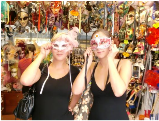
Bilder 21-26: Impressionen aus Venedig